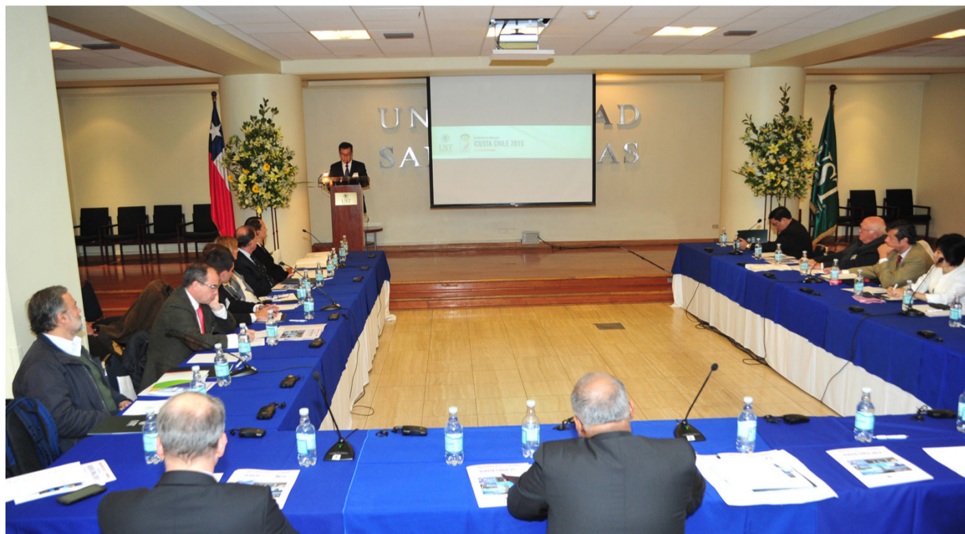
Los representantes de las instituciones pertenecientes a la Red ICUSTA, compartieron experiencias y discutieron sobre proyectos conjuntos.

La autoridad de la UST enfatizó además que espera que “de este encuentro surja una relación que a futuro nos permita seguir desarrollando proyectos de investigación conjuntos, buscando vinculación entre nuestras universidades y alcanzando un trabajo más potenciado, que favorezca nuestro crecimiento como instituciones que aportan al desarrollo de la sociedad”.