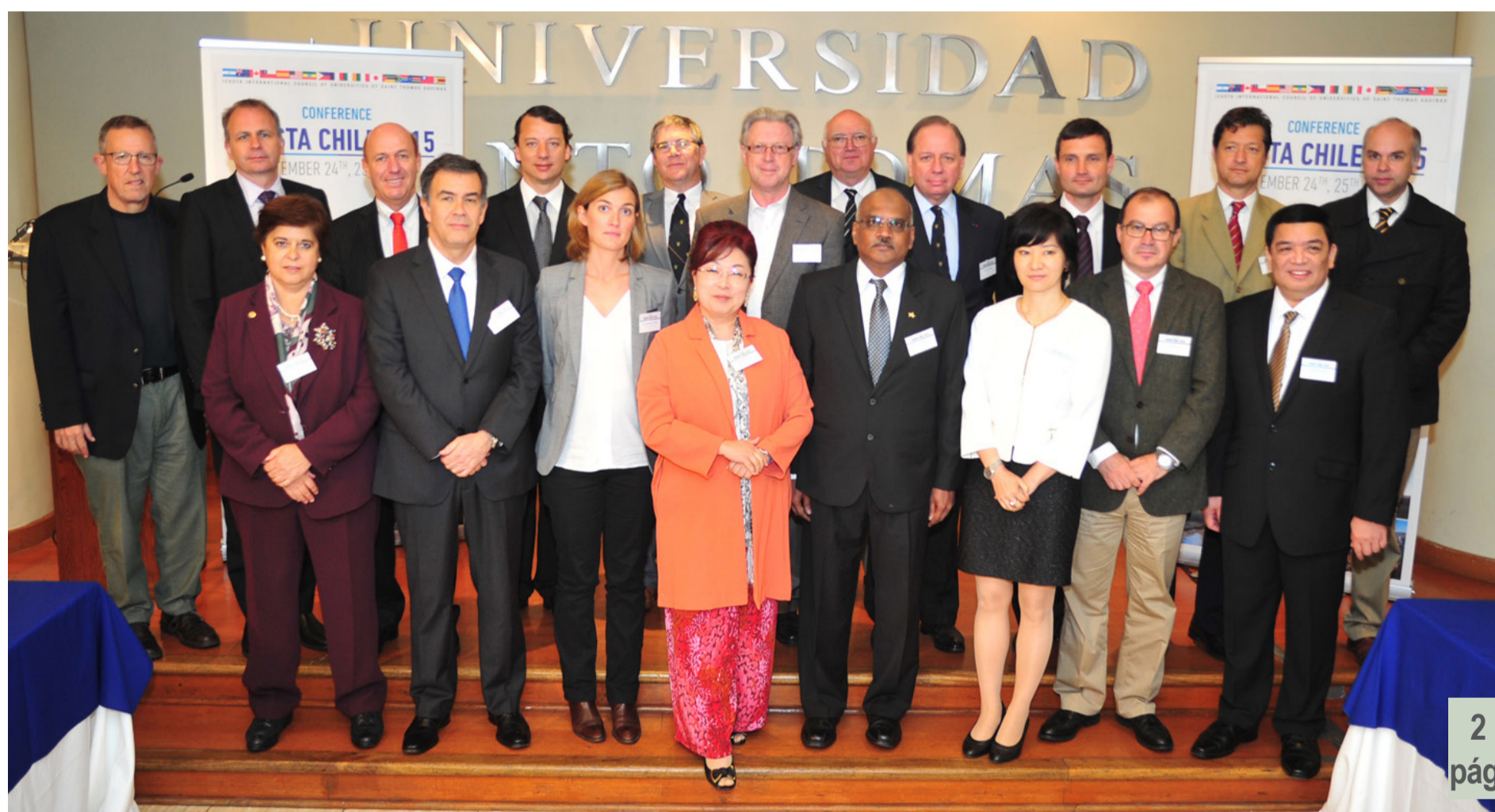
Asistentes a la 12° conferencia bienal de ICUSTA 2015.