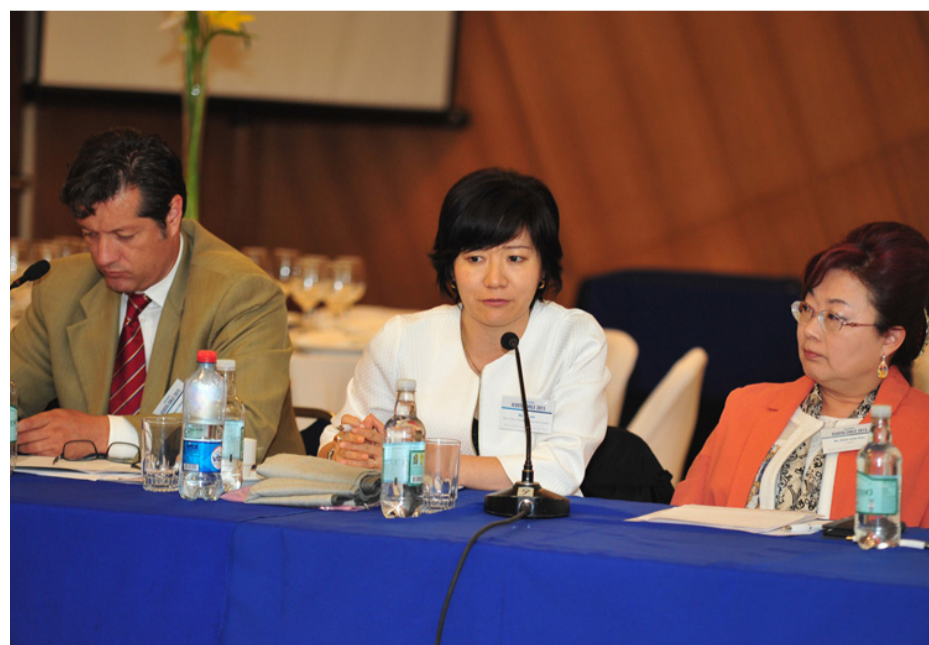
La Red ICUSTA está compuesta por 26 instituciones de 16 países, y desde su creación en 1993 ha promovido la cooperación y el intercambio académico entre sus estudiantes, profesores e investigadores.