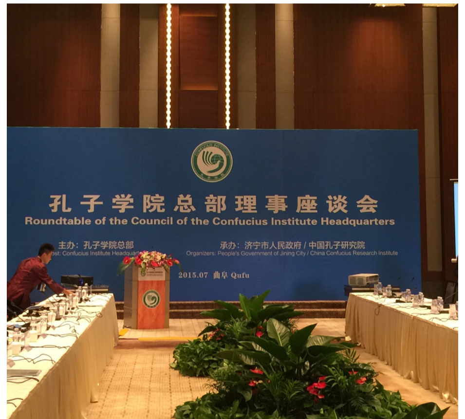
El Consejo Superior de Hanban se llevó a cabo en Qufu, ciudad natal de Confucio y donde se encuentran los más importantes monumentos en honor de este filósofo chino.