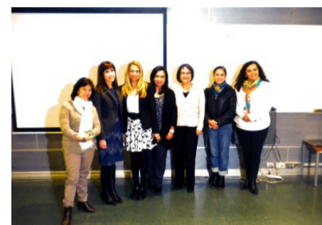
“La Importancia de la Investigación en la Salud”, fue una actividad organizada por las Escuelas de Enfermería y Nutrición y Dietética para sus alumnos.

Luego de presentar su trabajo respecto a la lactancia materna como método de prevención de enfermedades cardiovasculares e hipertensión, abrió el espacio para el debate y dudas de los estudiantes.