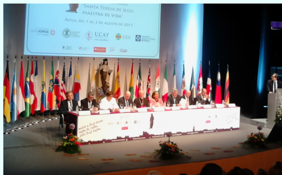
La Universidad Santo Tomás estuvo presente en el Congreso Interuniversitario "Santa Teresa de Jesús, maestra de vida" en Ávila, España.