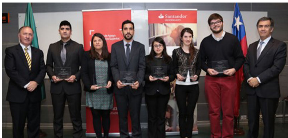
Grupo de alumnos y docente que recibieron la Beca Iberoamericana 2015.