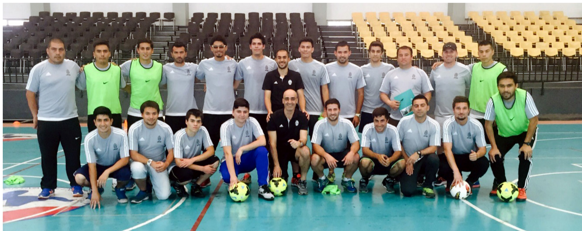
El encuentro se realizó el pasado 11 y 12 diciembre en el Instituto de Ciencias del Deporte de la Universidad Santo Tomás.

Con el objetivo de llegar a todo el mundo y dar la posibilidad a niños y entrenadores de vivir la experiencia Juventus, el actual subcampeón de la Champions League realizó por primera vez en Chile el curso Juventus Formazione, encuentro en el que 30 profesionales ligados al área de la formación deportiva conocieron el método de trabajo del equipo italiano.