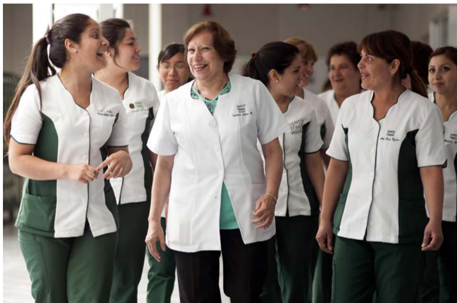
Desde las distintas sedes de Santo Tomás, ubicadas desde Arica a Punta Arenas, llegó hasta Ovalle un importante número de estudiantes y docentes de la carrera de Técnico en Enfermería.

El pasado viernes 27 y sábado 28 de noviembre en el Teatro Municipal de Ovalle, se realizó una nueva versión del III Congreso Internacional de Técnicos en Enfermería y el IV Congreso Nacional, encuentro para los profesionales de la salud que es organizado por el Centro de Formación Técnica e Instituto Profesional Santo Tomás.