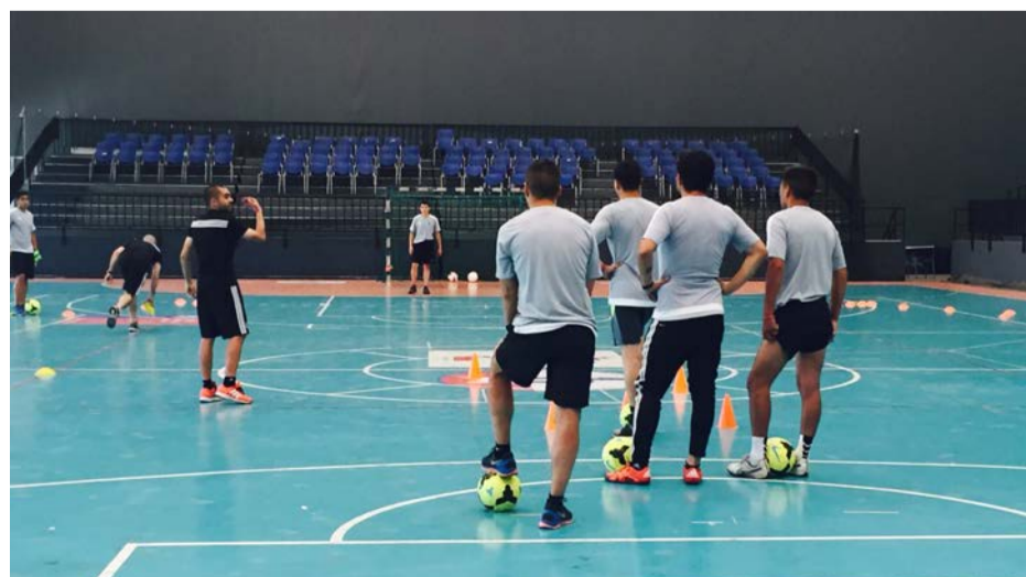
El curso Juventus Formazione enseñó el método de trabajo que utiliza el equipo italiano, técnica que le ha permitido alcanzar el éxito a nivel mundial.