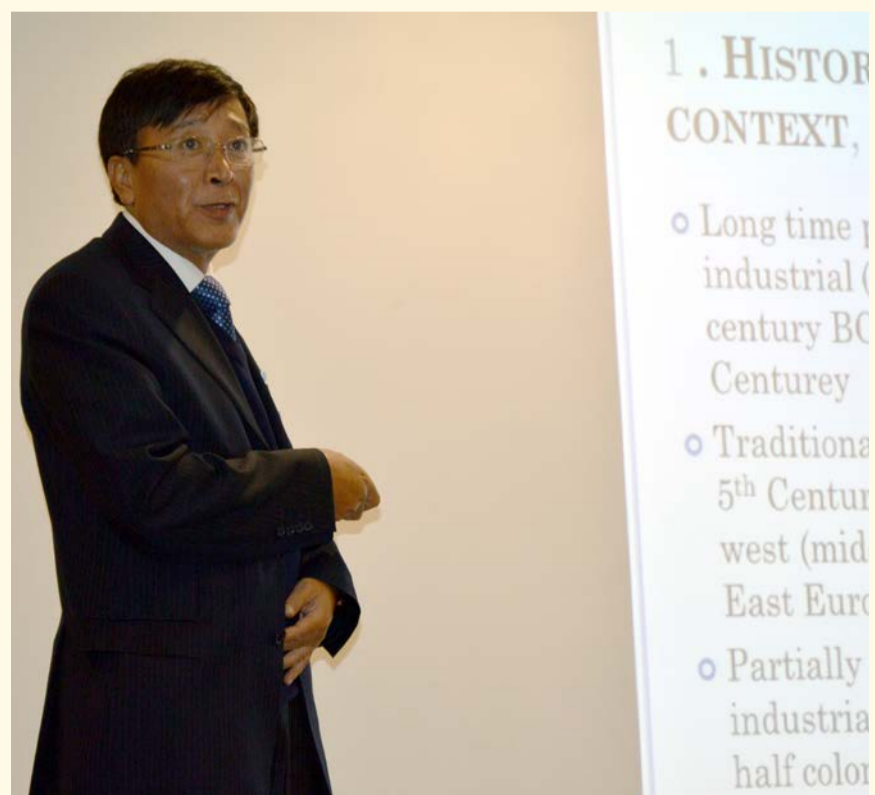
El investigador chino expuso ante empresarios, académicos, docentes y estudiantes.