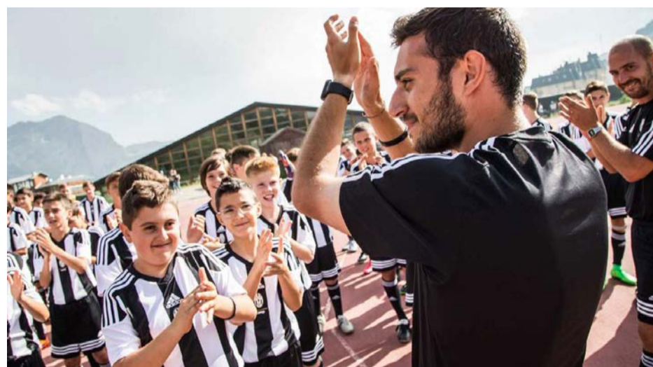
Juventus Camp esta en Chile hace cuatro años y ya ha realizado cinco clínicas de fútbol a lo largo del país.