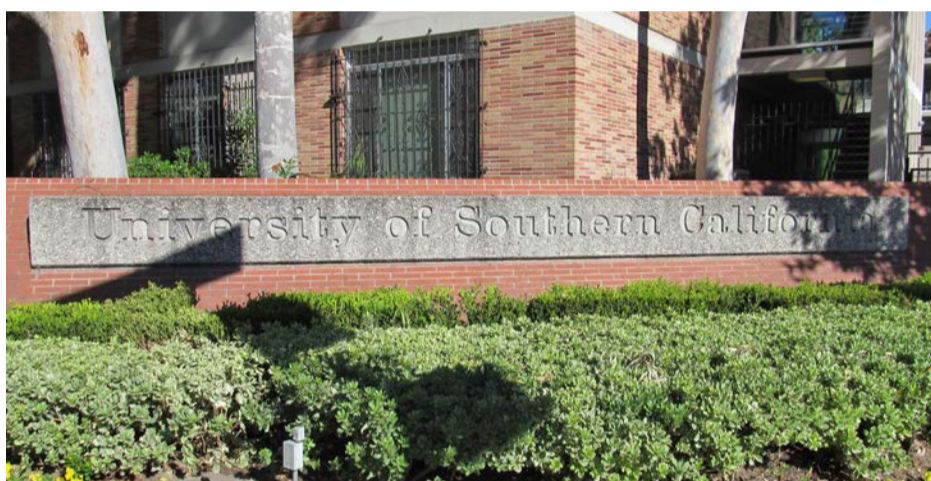
En la University of Southern California, la académica de la Escuela de Geología de la UST Santiago realizó su pasantía.

Asimismo, destacó que lo aprendido en esta experiencia también será beneficioso para sus alumnos, ya que "este tipo de experiencias nos enriquecen académicamente y eso se transmite a los alumnos, ampliándoles la visión de la carrera y del mundo laboral. Por otro lado, este tipo de intercambios crean redes que pueden favorecer el futuro de los alumnos interesados en la investigación".