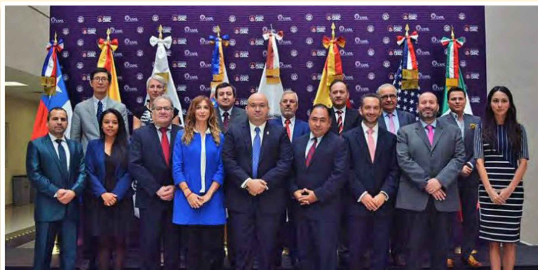
Consejo Consultivo internacional integrado por el director académico de la UST Talca.