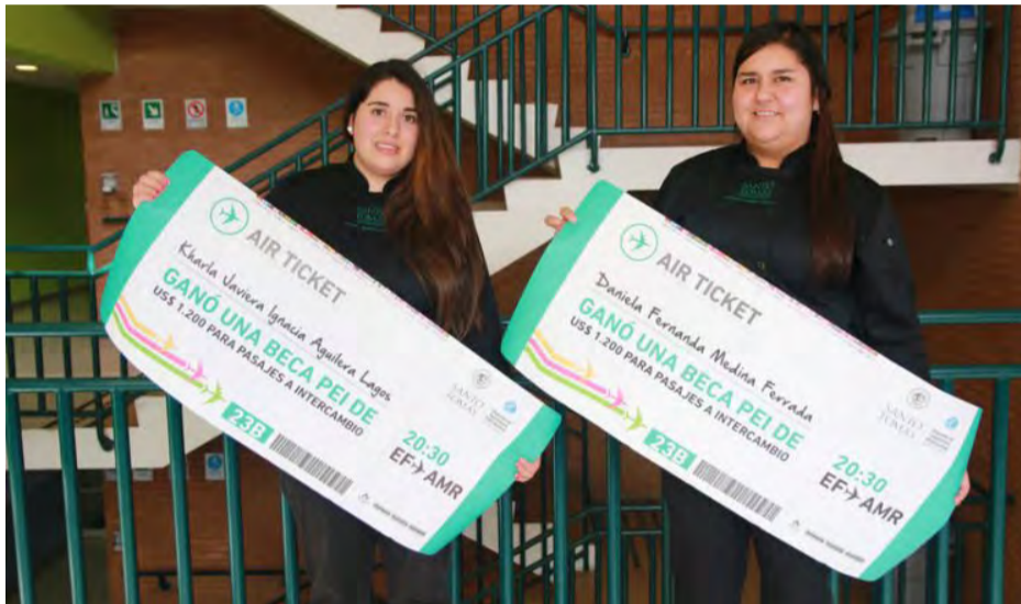
Las alumnas viajarán a la Universidad del Caribe en México por un periodo de cinco meses.