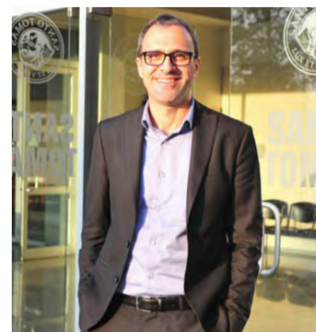
El director de comunicaciones del Mundial de Fútbol de Brasil 2014 visitó el Instituto de Ciencias del Deporte de la Universidad Santo Tomás para contar su experiencia a los alumnos.

para ver si vuelve a candidaturas duplas como hubo el 2002 con Japon-Corea, para mí un mundial latinoamericano es un sueño. ¿Si pudo Brasil, por qué no Chile, Argentina o Uruguay?