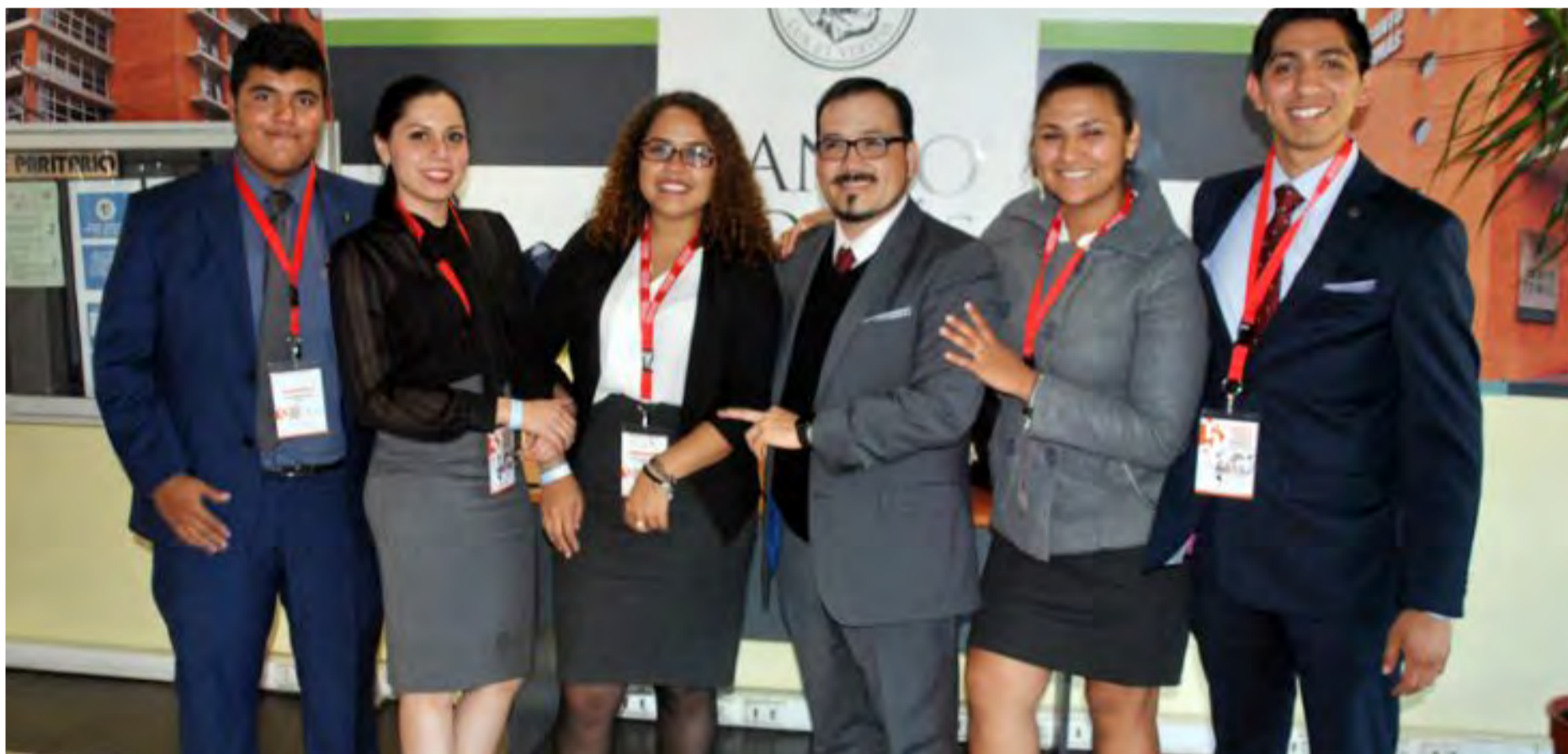
El equipo de Univer Zamora señala que participar en el Torneo Internacional de Debates es una experiencia que marcará su futuro.