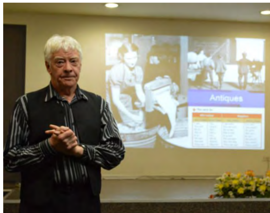
Académico británico visitó La Araucanía para hacer una charla sobre prácticas nuevas de pedagogía en inglés.

Y como segunda arista de la jornada, los alumnos y docentes, realizaron un taller sobre tareas y test de aula enfocados en los procesos de aprendizajes, desarrollo de habilidades y competencias, con el objetivo de medir más allá de los conocimientos que tradicionalmente se evalúan.