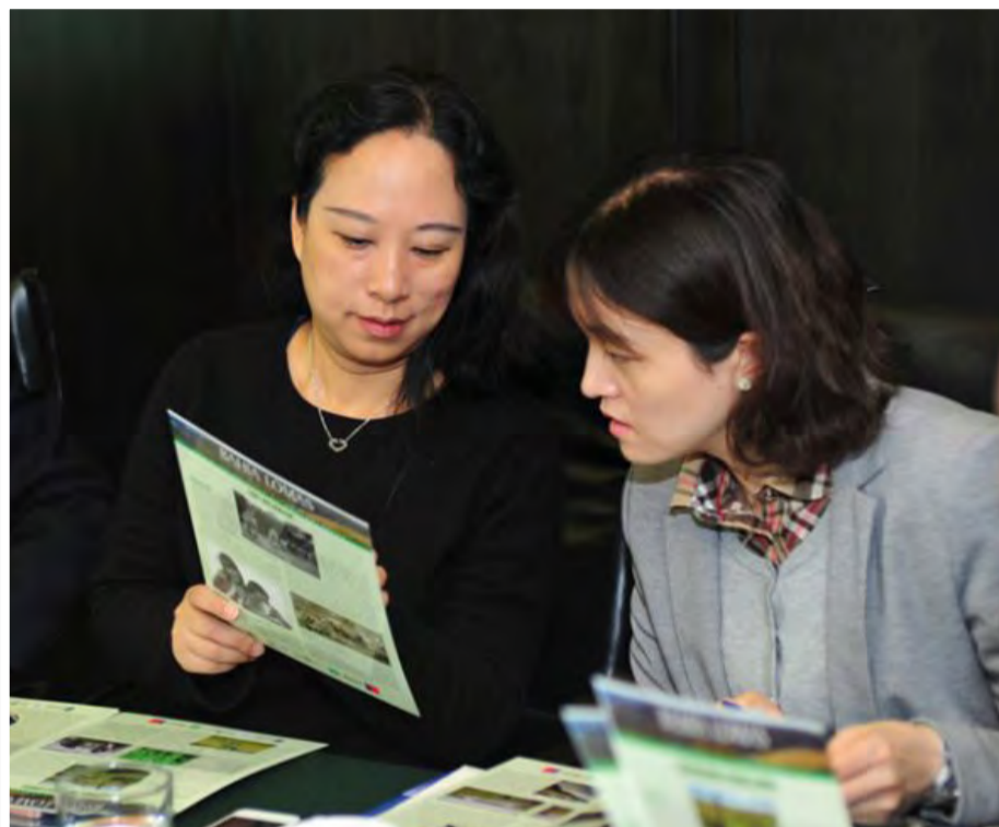
Una importante comitiva de la East China Normal University (ECNU) de Shanghái, una de las diez universidades más importantes de China, visitó hace unos días dependencias de Santo Tomás.

Para este año se espera que un grupo de docentes de la East China Normal University visite nuestra institución como parte del programa de intercambio, continuando así con las actividades del convenio de cooperación firmado el año 2013, y al que se suma uno específico de investigación conjunta suscrito en 2015.