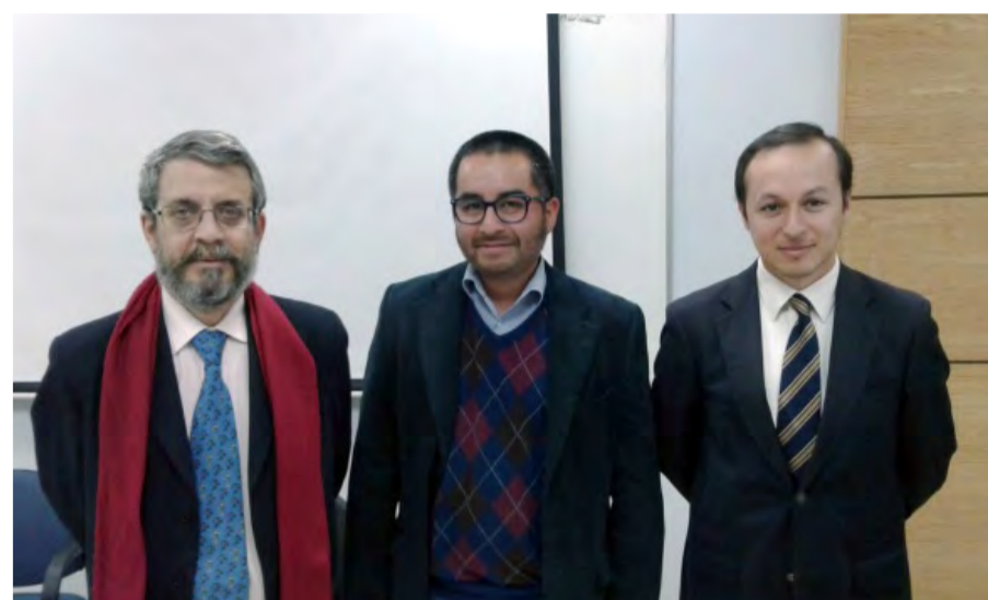
El Congreso reunió a profesores de Francia, Argentina, Brasil, México, Uruguay, Haití y Chile.

Las instituciones que organizaron el congreso fueron la Universidad Nacional de General Sarmiento, Buenos Aires, Argentina, el Laboratorio “France, Amériques, Espagne – Sociétés, pouvoirs, acteurs” de la Université