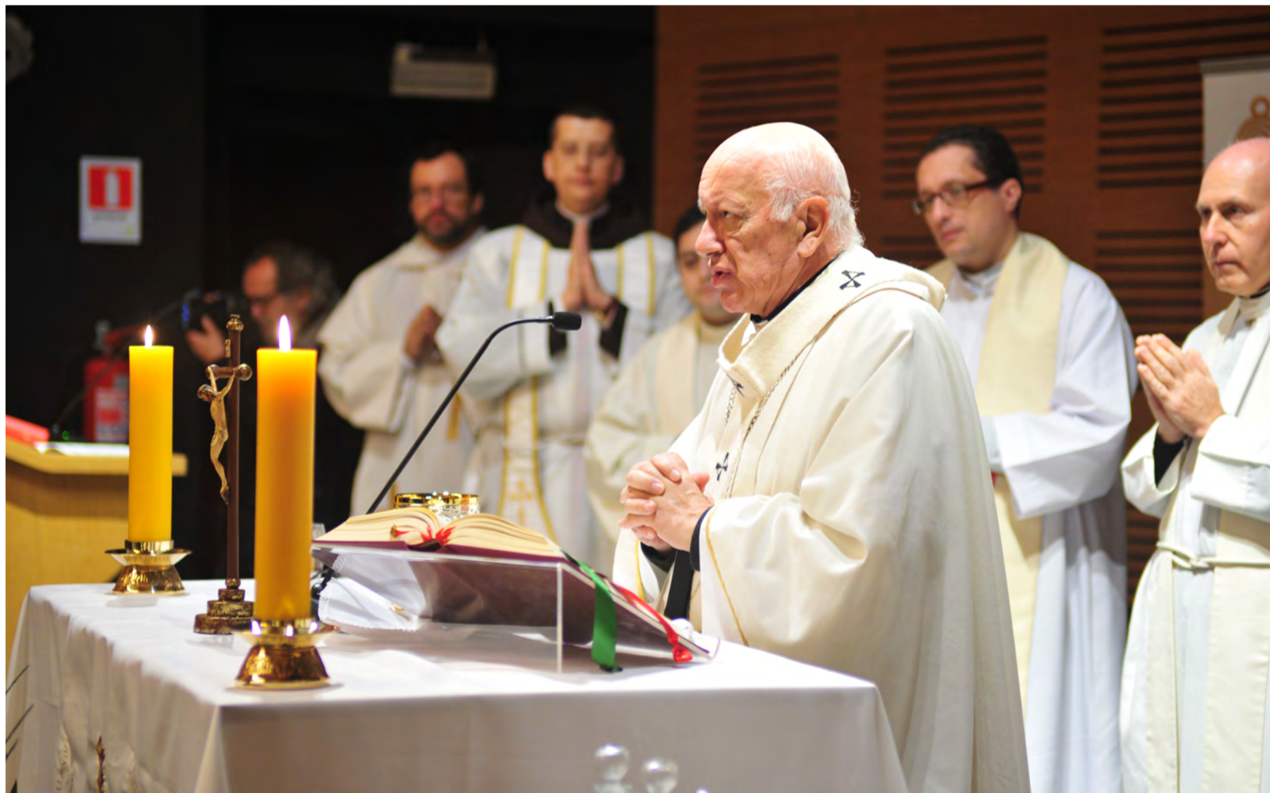
Con una misa inaugurada por el Cardenal Ricardo Ezzati, se dio inicio al Congreso internacional de Filosofía Tomista.

Algunos de los tomistas más connotados de Iberoamérica, España, Polonia y Estados Unidos, se reunieron entre el 19 y el 21 de julio en el Instituto profesional Santo Tomás San Joaquín para ser parte del III Congreso Internacional de Filosofía Tomista, que este año abordó los grados y tipos de conocimiento.