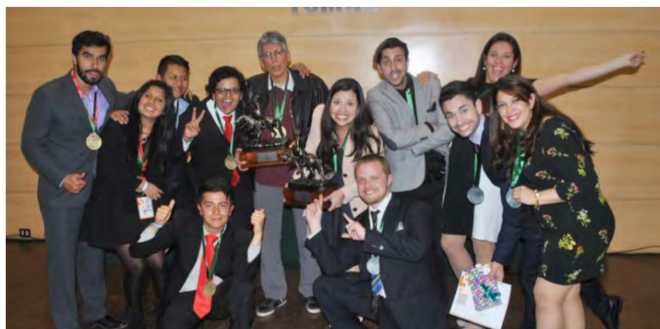
Las delegaciones de UST Santiago y Universidad Nacional de Colombia fueron declaradas como ganadoras del certamen.